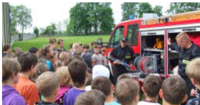
Strażacy podczas akcji edukacyjnej.

Ogólnopolski Turniej Wiedzy Pożarniczej „Młodzież Zapobiega Pożarom” ma na celu popularyzowanie przepisów i kształtowanie umiejętności w zakresie ochrony ludności, ekologii, ratownictwa i ochrony przeciwpożarowej.